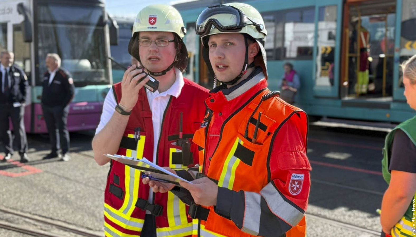
Damit jeder Handgriff sitzt, proben die Malteser zusammen mit Feuerwehr, THW und anderen Organisationen regelmäßig den Ernstfall, hier einen Total-Blackout in Frankfurt/Main.