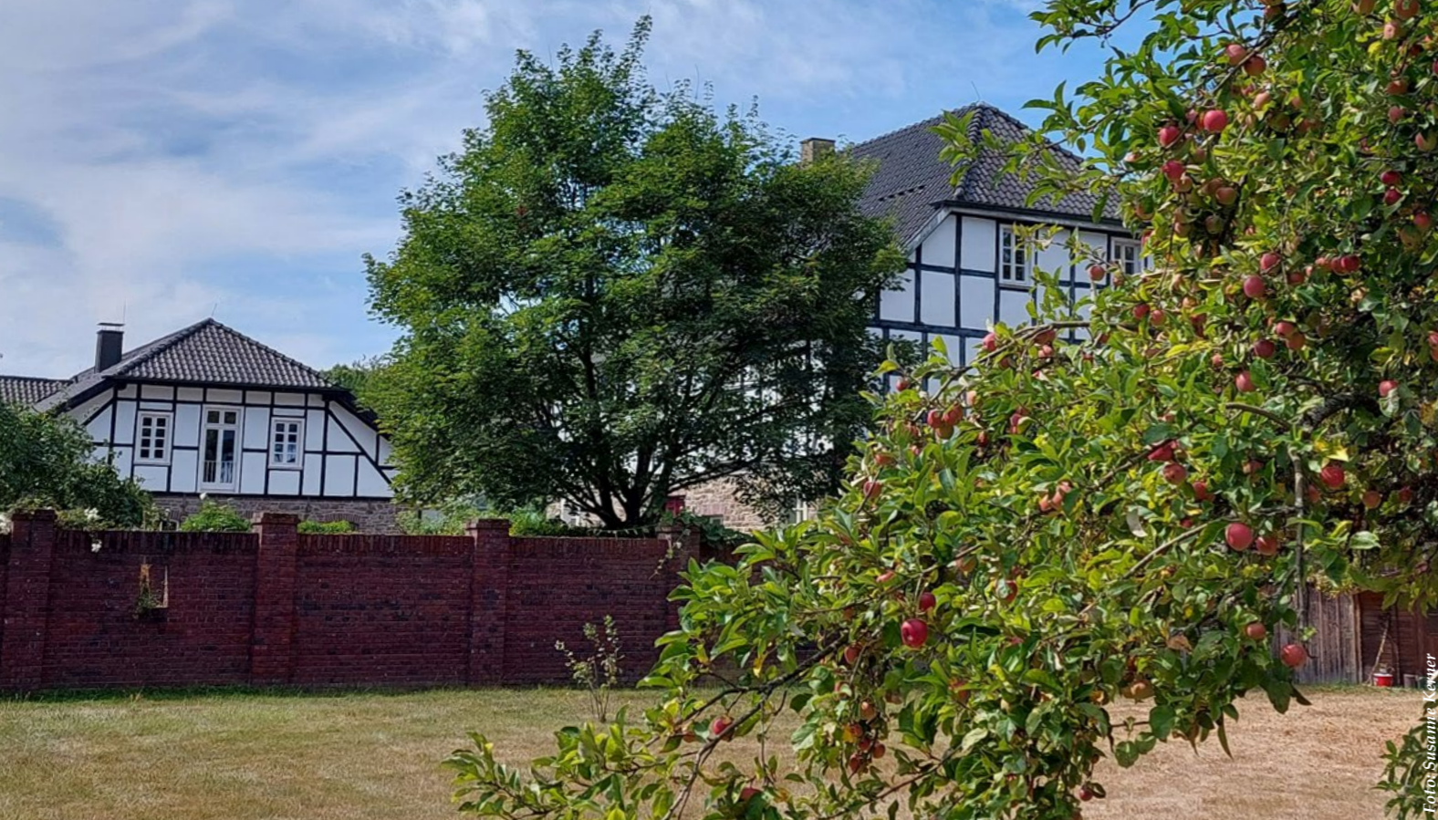
Zur Ruhe kommen in guter Gesellschaft: In der Malteser Kommende in Ehreshoven finden auch Auszeiten für Helferinnen und Helfer statt.