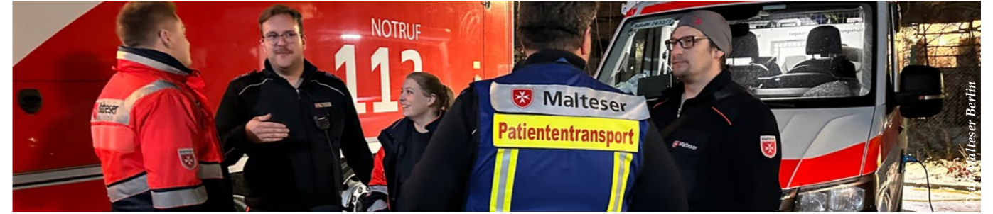
Im Dauereinsatz: Fahrerinnen und Fahrer des Malteser Krankentransports planen ihre nächsten Touren.

ihre Grenzen stoßen, füllen Ehrenamtliche die Lücke – professionell, handlungsstark und ohne zu zögern.