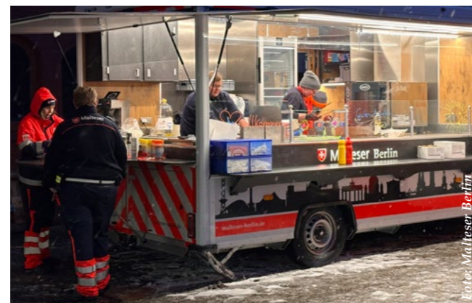
Im Dauereinsatz: Die Malteser geben warme Mahlzeiten an Helfende aus – trotz Schnee und Kälte.

Gleichzeitig wird sichtbar, wie entscheidend freiwilliges Engagement für das Funktionieren des Bevölkerungsschutzes ist. Dort, wo staatliche Stellen an