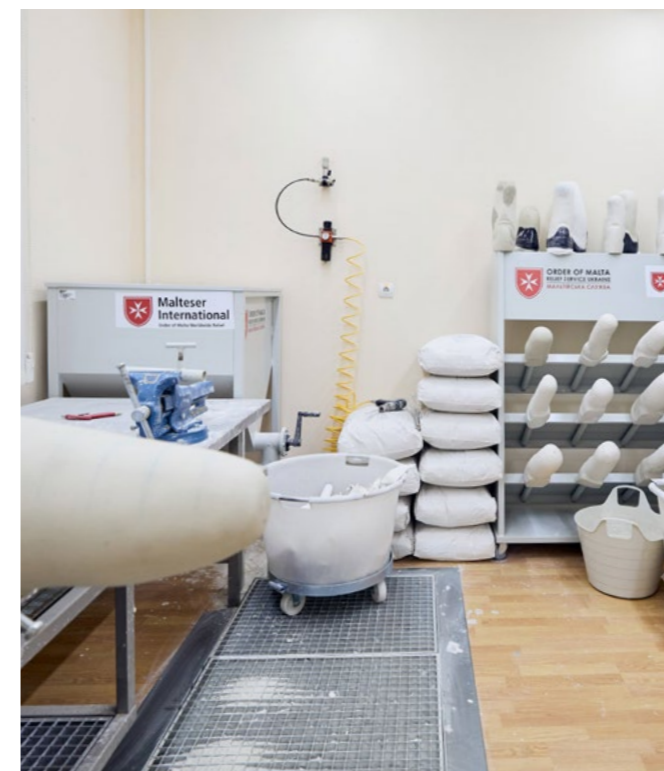
Prothesen, am laufenden Band. Das Zentrum in Lviv bildet Menschen auch in der Fertigung aus, um den großen Bedarf zu decken.

Rund 300 Menschen werden derzeit in zwei Gebäudeteilen des Zentrums betreut – beide am Limit. Für Transporte, psychosoziale Räume, zusätzliche Fachkräfte und modernere Ausstattung fehlen Mittel. Trotz aller Herausforderungen zeigt jede Begegnung im Zentrum eines: Hilfe wirkt. Sie gibt Mobilität zurück, schenkt Würde und eine Perspektive für ein selbstbestimmtes Leben. Oder, wie es ein Veteran ausdrückt: „Ohne Beine – na gut. Aber ich bin am Leben.“