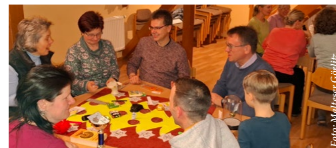
Spieleabende wie hier bei einem Danke-Wochenende schaffen Raum für Austausch, Gemeinschaft und neue Kraft im Ehrenamt.